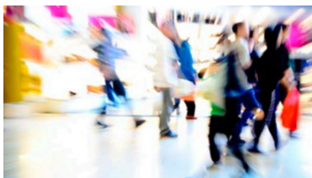
Introducing VINCI Energies

El Grupo VINCI es un actor mundial en los sectores de construcción y concesión. VINCI Energies representó más de un cuarto de su actividad en 2015 (26,5% de sus ingresos).